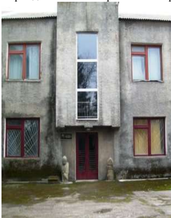
Амвросиевский историко-краеведческий, народный музей