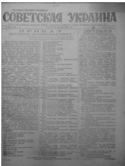
Приказ Верховного главнокомандующего И.В. Сталина об освобождении Донбасса в газете «Советская Украина» 10 сентября 1943 г. ГА ДНР. Ф. Г-107. Л. 1.

Начиная с первых дней, после освобождения, все предприятия, организации, учреждения, горкомы и райкомы, органы исполнительной власти, приступили к работе. Основной задачей было возобновление работы всех сфер народного хозяйства. Не были забыты подвиги воинов Красной Армии. Необходимость увековечивания памяти жертв и героев Великой Отечественной войны стала