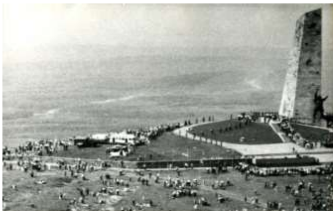
Монументальный комплекс «Освободителям Донбасса» на Саур-Могиле, г. Снежное. Фото. 1985 г.

«Освободителям Донбасса» в парке Ленинского комсомола 8 мая 1984 года, огонь был взят у монумента на Саур-Могиле и привезен в г. Донецк. Почетное право зажечь вечный огонь, было предоставлено генерал-лейтенанту Н.М. Ляшко, начальнику политотдела 50-й Гвардейской дивизии, освобождавшей г. Сталино [10].