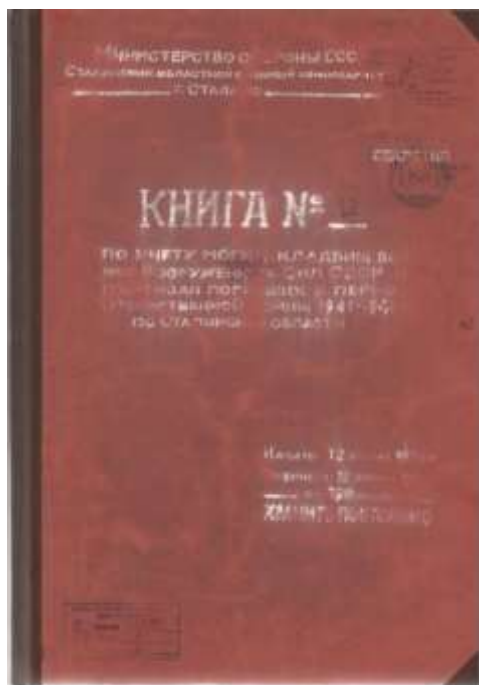
Книга № 12 по учёту могил воинов Вооружённых Сил СССР и партизан погибших в период Великой Отечественной войны 1941-1945 гг. по Сталинской области 1950 г. ГА ДНР. Ф. Р-6338, оп. 1, д. 7

Сведения из «Книги по учёту могил воинов Вооружённых сил СССР и партизан погибших в период Отечественной войны 1941-1945 гг. по Сталинской области», собранные областным военным комиссариатом, указывают на факты масштабного захоронения в данном месте. Из «Книги...» следует, что на «Саур-могиле захоронены офицеры, сержанты, красноармейцы 5-й Ударной Армии, 293-го и 295-го гвардейских стрелковых полков. Все они погибли 30 августа 1943 г. при взятии высоты 277,9 на Саур-Могиле. Фамилии погибших неизвестны, количество – 132 человека» [2].