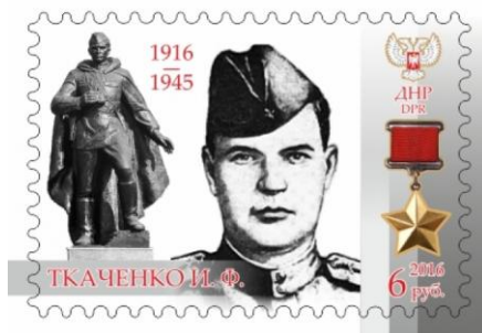
Почтовая марка, посвященная И.Ф. Ткаченко, г. Донецк

В 2016 г. в честь 100-летия Ивана Филипповича Ткаченко в г. Донецке была выпущена почтовая марка. На ней изображен Иван Ткаченко, памятник в его честь и Звезда Героя Советского Союза.