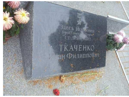
Фрагмент памятника И.Ф. Ткаченко. Мемориальная плита. г. Зеленоградск.

Памятник представляет собой ростовую скульптуру советского воина, с воинской каской в руке, на постаменте. Перед постаментом – мемориальная плита с текстом: «Здесь захоронен Герой Советского Союза ст. лейтенант ТКАЧЕНКО Иван Филиппович».